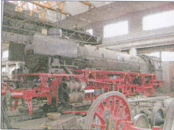
Noch ohne Radsätze und Gestänge sieht 41 096 etwas "nackt" aus.