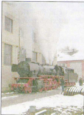
Das erste Mal wieder unter Dampf. Die Sicherheitsventile werden eingestellt.