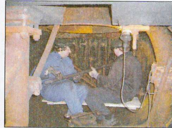
Fleißige Vereinsmitglieder beim Ausbau des alten Überhitzers.