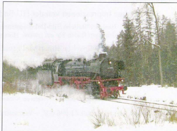
Die 41 096 auf ihrer ersten Probefahrt bei der Ausfahrt aus Ceske Velenice am 25. Februar 2009.