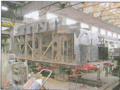
Der Tender mit neuer Rückwand, die Seitenwand ist noch in Arbeit.